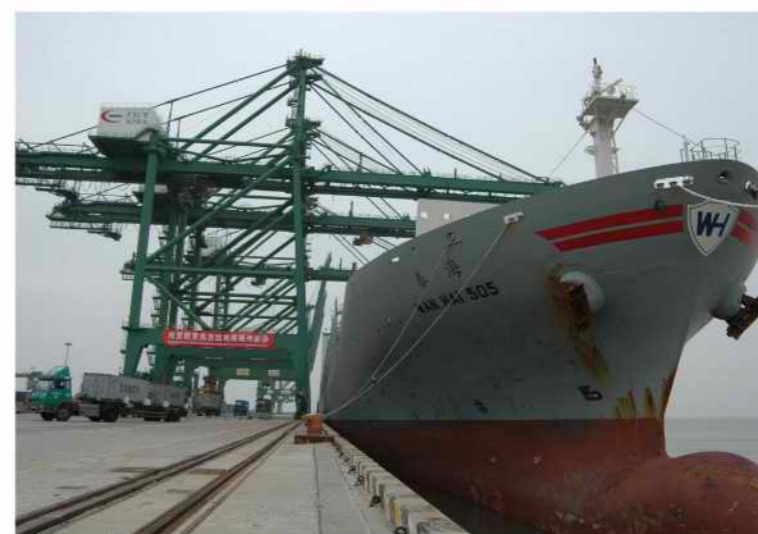
■ 文：林 田 行政/人事部

2011年4月4日，万海航运“海春轮”首航靠泊福州新港国际集装箱码头，这是福州新港继1月份马士基航运开通西非线后，今年新开辟的第二条集装箱远洋干线。