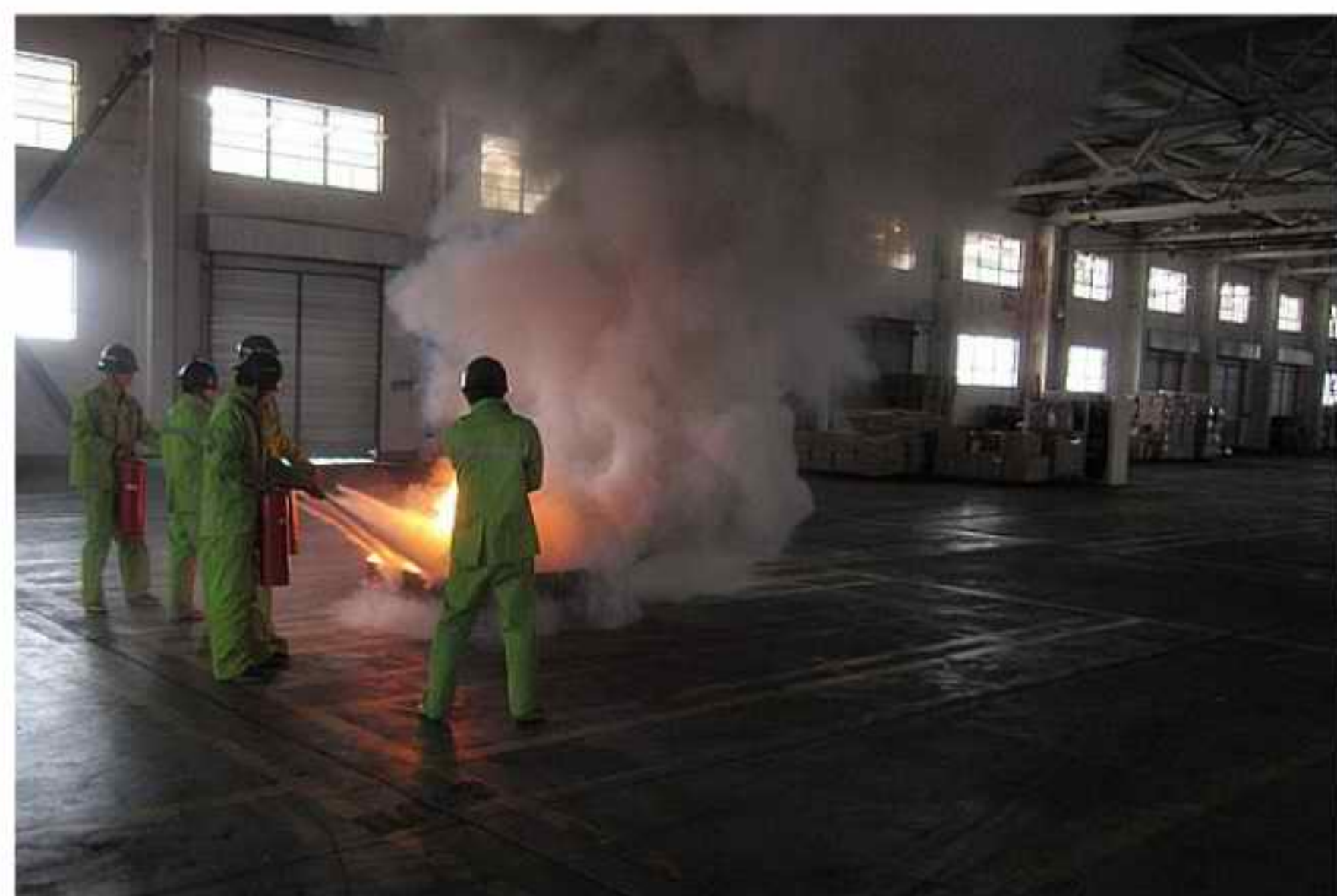
■ 文/摄：宋轶群 安监保卫科

为提高作业人员的应急疏散逃生能力，提高员工安全意识，3月28日上午，集团所属福州青州集装箱码头在货运站内举行人员应急疏散演练。